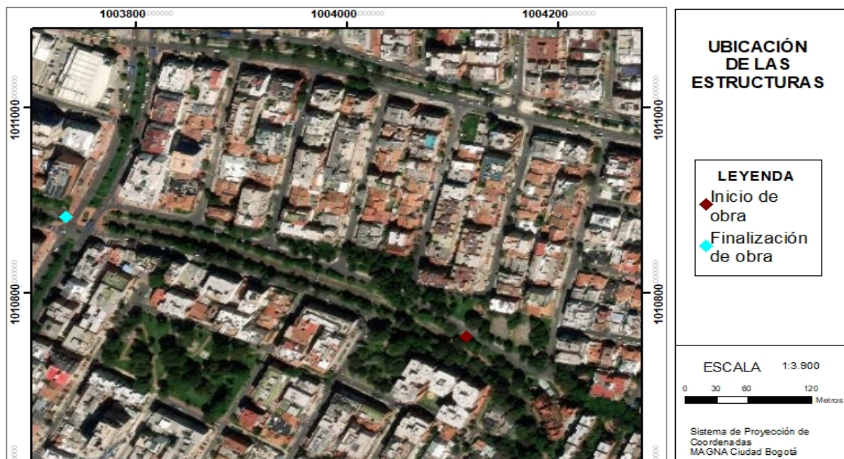
Imagen No 2. Localización general del Canal Molinos inicio y final de tramo a intervenir.

A continuación, se muestra la ubicación del tramo a intervenir en el CANAL MOLINOS así: